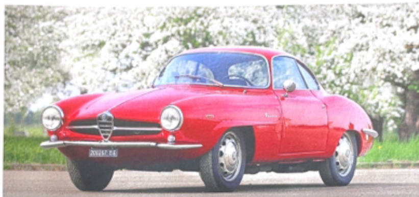
ALFA ROMEO GIULIETTA SPRINT SPECIALE